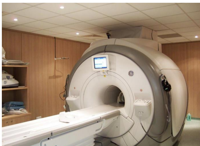
Blindage Magnétique IRM