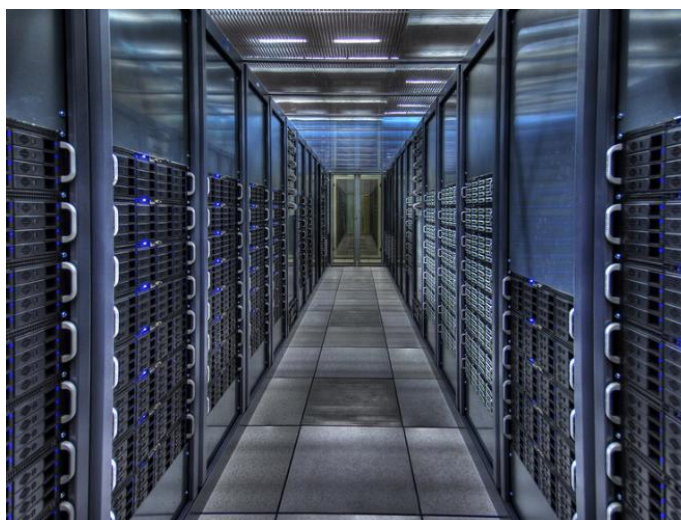
Blindage Magnétique Data center